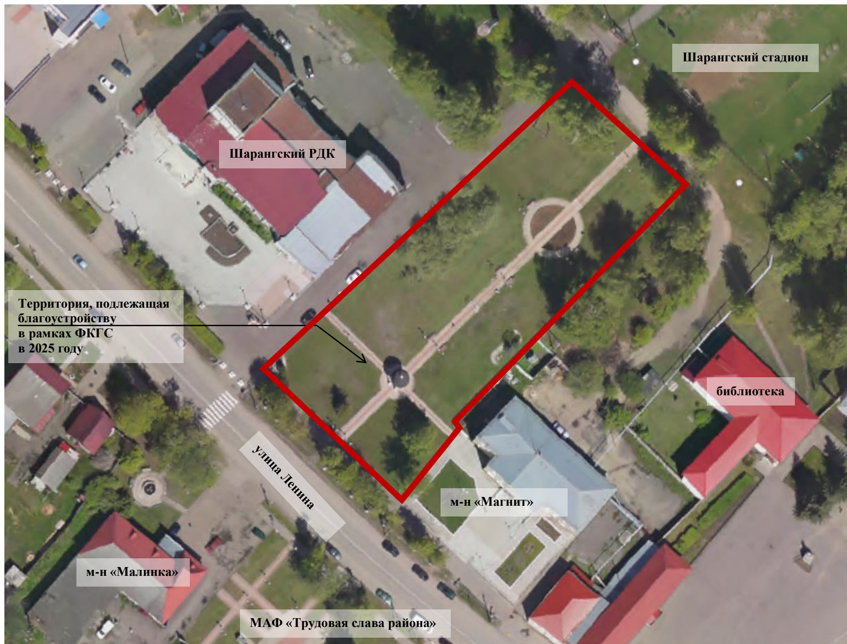
СХЕМА РАСПОЛОЖЕНИЯ ОБЪЕКТА НА ПЛАНЕ ТЕРРИТОРИИ