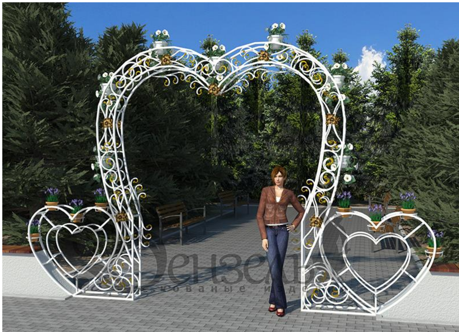
Вариант 2. Арка-Сердце металлическая.